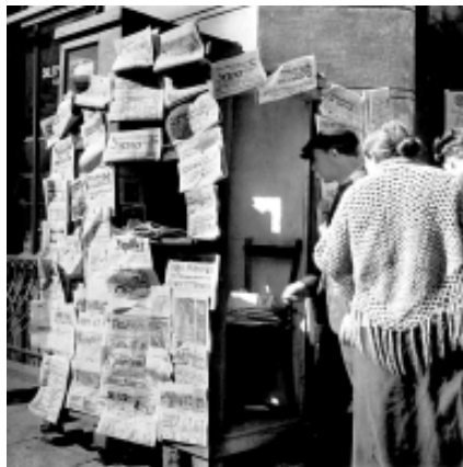
На вулицях довоєнної Варшави (Фотоальбом Романа Вишняка, Мюнхен, 1933 р.)

вом ви змогли врятуватися і вижити, ви мусили возз'єднатися з іншою людиною».