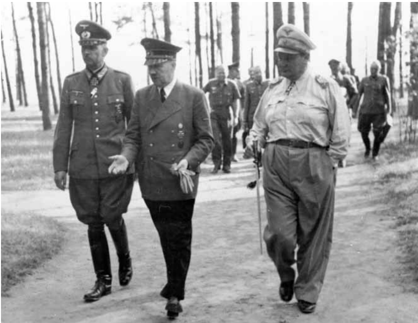
Гітлер із генерал-фельдмаршалом Вільгельмом Лістом та Германом Гьорінгом у штаб-квартирі «Вервольф», Вінниця, 31 серпня 1942 р.

Приблизно у той час, коли Гітлер прибув до своєї штаб-квартири «Гегевальд» (24 липня 1942 р.), керівник СС та поліції Житомира Отто Гельвіг наказав начальнику СД Бердичева, гауптштурмфюреру Алоїсу Гюльсдюнкеру, стратити 300 останніх євреїв Бердичева, включно із вісімдесятьма жінками та десятьма дітьми, яких було виявлено після останньої розправи 106 . Гюльсдюнкер, який таємно дозволив тридцятьом євреям працювати на своєму посту, свідчив після війни, що він не спішив виконувати цей наказ. За його словами, його послали в Бердичів із Райху, тому що начальство запідозрило в ньому недостатню ідеологічну відданість нацизму 107 . Служба на сході мала загартувати його.