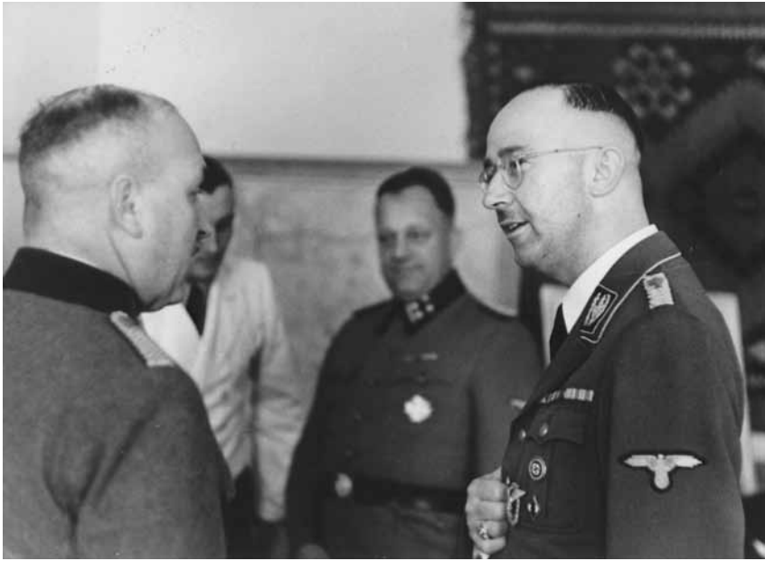
Гімлер приймає привітання з нагоди дня народження від колег по СС-поліції у своєму кабінеті у «Гетевальді», 7 жовтня 1942 р. (Меморіальний музей Голокосту США, люб'язно надано Джеймсом Блевінсом, № 60390).

врятувати життя євреїв. Незалежно від того, чи було це пов'язано із корисливими інтересами чи мораллю, дехто із місцевих німецьких керівників таємно брали на роботу євреїв. Регіональних німецьких посадовців було неодноразово попереджено про необхідність передачі цих євреїв до найближчого штабу СД. Окрім цього, незначна кількість євреїв продовжувала займати посади кваліфікованих робітників у різних галузях. Наприкінці жовтня 1942 р. економічний аналітик із міського комісаріату Вінниці підтвердив те, що більше не існувало жодного єврейського цеху, оскільки «єврейське питання» було «з'ясовано», але він також додав, що окремі євреї все ще працювали у структурі різних галузей місцевої економіки, скажімо, 300 осіб працювали на місцевій фабриці з пошиття одягу 110 . Експлуатація нацистами робочої сили євреїв означала, що відносно невелика частина єврейського населення мала шанс пережити Голокост, і багато євреїв надіялися, що саме їм вдасться бути серед небагатьох врятованих. Проте, використання нацистами єврейських трудових ресурсів не було характерною рисою там, де німецькі керівники нижчого рівня в СС та поліції або інших установ намагалися врятувати євреїв або протидіяти «остаточному розв'язанню єврейського питання». Тиск з боку керівників та їхніх палких послідовників, які прагнули контролю над повсякденною