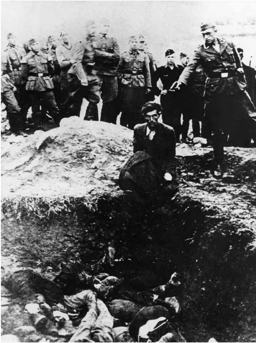
Німецький СС-поліцай розстрілює єврея у Вінниці в оточенні службовців СС-поліції та Вермахту (Меморіальний музей Голокосту США, надано Ullstein Bild, № 00463386).

кілька будинків, бараки, елегантні апартаменти та бункер із грубими бетонними стінами 104 .