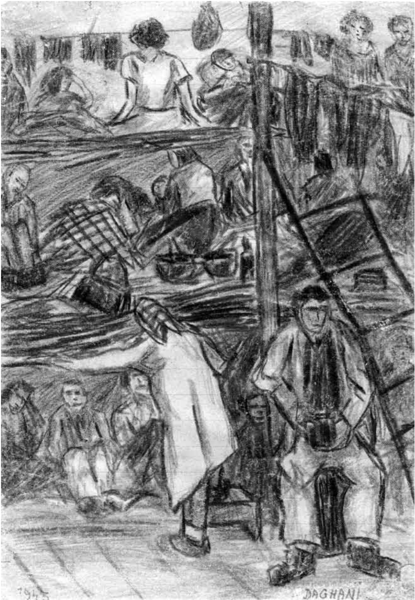
Арнольд Дагані (1909–1985), «Повернення “додому” з роботи», 1943 р. Олівець на папері. (Колекція музею мистецтва при «Яд Вашем», Єрусалим).

кілька сот метрів від місця роботи; потім один із охоронців застрелив їх. Бригадири ОТ знущалися над робітниками образливими словами, такими як, наприклад, зауваження молодого водія ОТ Ернста Йозефа Геннеса,