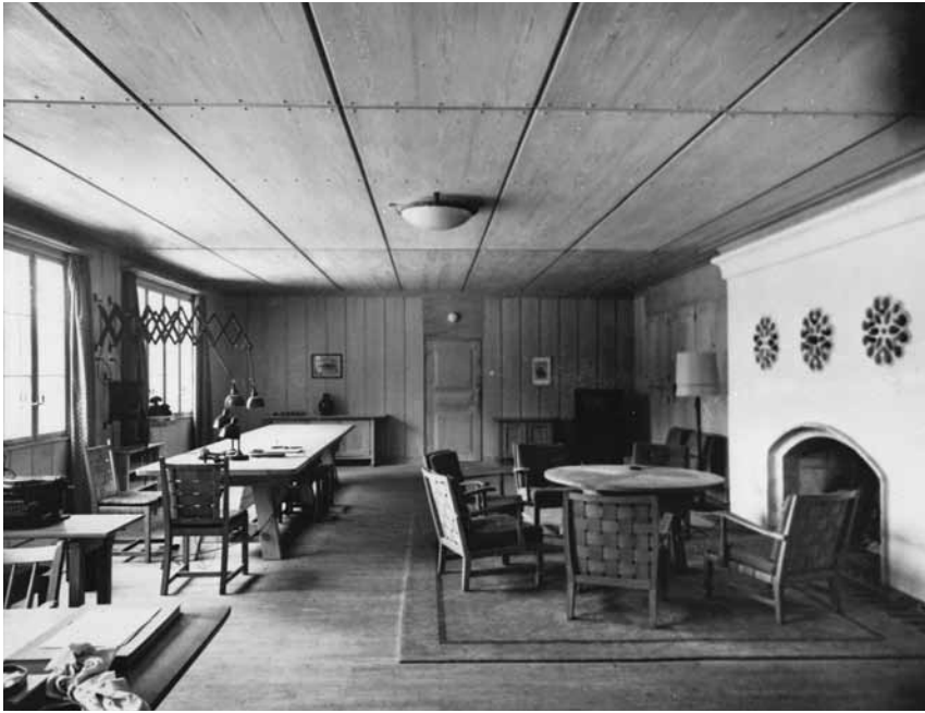
Кабінет Гітлера у «Вервольфі». Фотографію зроблено під час останнього перебування Гітлера в штаб-квартирі у період із 19 лютого по 13 березня 1943 р..

Гюльсдюнкер підкорився і почав організацію розправи над 300 євреями у таборі. 15 червня 1942 р. німецькі керівники СС-поліції в Бердичеві та їхні українські помічники перевели євреїв у стайні, а потім відвели групами до рову, викопаного на відстані кількох сотень метрів. Кілька євреїв намагалися втекти, але були застрелені. Інших змусили лягти обличчям донизу на дні рову і вбивали пострілами в голову. Українська міліція накривала тіла землею. Гюльсдюнкер зателефонував Рацесбергеру, щоб відрапортувати про те, що наказ про ліквідацію табору було виконано. Без відома Рацесбергера, тридцятьох євреїв, які працювали в штабі СД, було врятовано. У своєму повоєнному свідченні Гюльсдюнкер заявляв, що дехто зміг втекти після того, як восени 1943 р. зіпо-СД закрило свою контору 108 . Васілій Гроссман, який у 1943–1944 рр. збирав свідчення про Голокост у Бердичеві, дізнався, що німці застрелили цих останніх євреїв-робітників тоді, коли Червона армія наближалася до Житомира. Один чоловік, майстер з виготовлення зброї на ім'я Хаїм Борисович Сагановський, дивом вижив 109 .