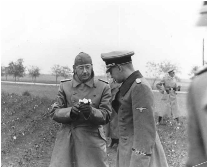
Гімлер перевіряє бавовняні поля в Україні, осінь 1942 р. (Меморіальний музей Голокосту США, люб'язно надано Джеймсом Блевінсом, № 60407).

Через місяць після цього, 10 жовтня, почалася акція з переселення. Німецькі поліцейські підрозділи, підпорядковані головнокомандувачу СС та поліції Гансу-Адольфу Прюцманну, службовці місцевої жандармерії та керівники Управління з питань зв'язків із етнічними німцями зібрали 10 623 ненімців, що проживали на цій території, а також певну кількість голів худоби, і розмістили їх у 770 вантажних автомобілях, що прямували до Дніпропетровська. Водночас колони, або ж, як називали їх нацисти, «групи переселенців», етнічних німців загальною кількістю 6 362 особи (1579 чоловіків, 2371 жінка та 2412 дітей) перебралися до Гегевальду із різних місць північної Житомирщини. Як етнічних німців, так і українців переселяли примусово під вартою поліції 62 . NSV допомагало етнічним німцям на зупинках по дорозі. Для колони із 2500 етнічних німців Овруча було зарезервовано п'ять сіл для ночівлі та відпочинку під час подорожі до Гегевальду; жителів цих сіл просто виводили із їхніх домівок та поміщали у тимчасові табори; багатьох відправляли як примусових робітників до Райху. NSV виділило десять медсестер зі свого персоналу для допомоги етнічним німкеням-матерям та їхнім немовлятам 63 .