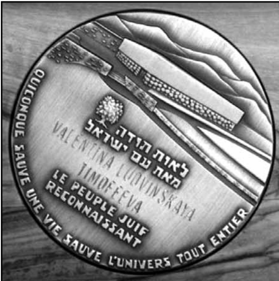
Медаль Праведника світу Людвінської Валентини Лаврентіївни.