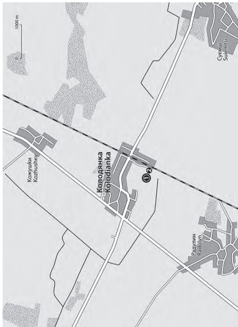
Меморіал євреям Колодянки і околиць: 1 – Меморіал жертвам Голокосту. 2 – Залізнична станція Memorial to the Jews of Kolodianka and the Surrounding Area: 1 – Holocaust Memorial. 2 – Train station