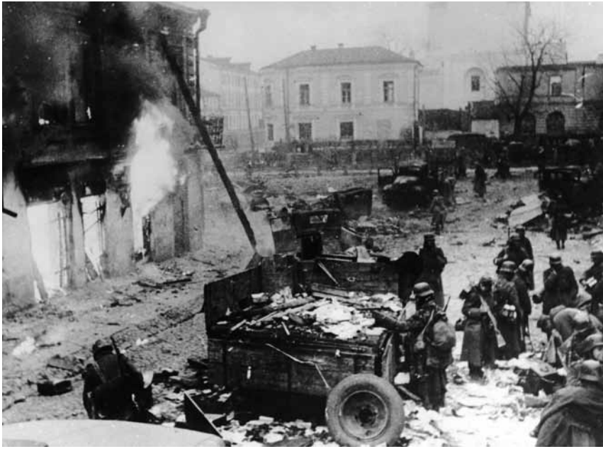
Німецькі солдати під час повторного захоплення Житомира, грудень 1943 р.